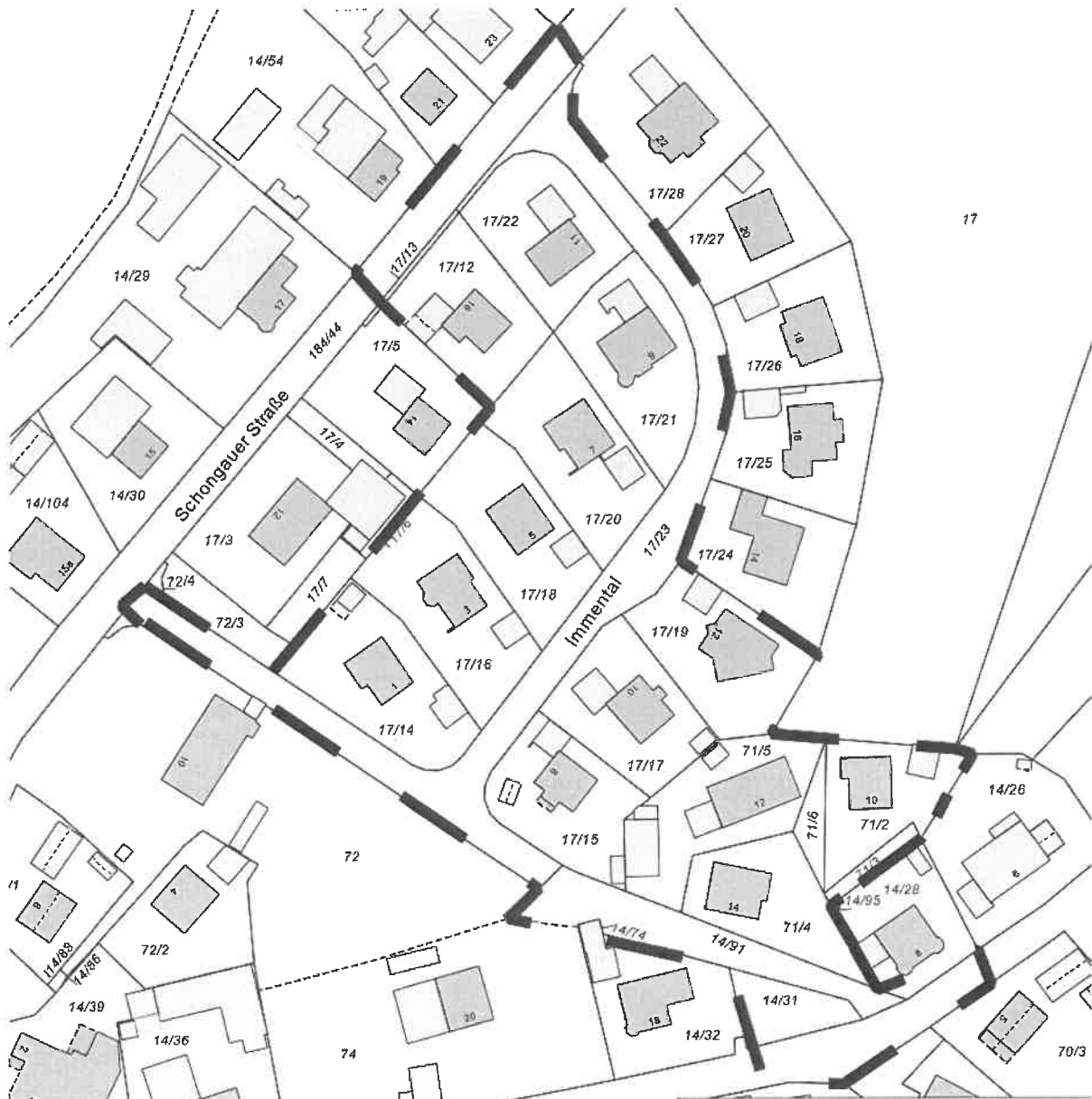
Geltungsbereich Pfarrböden, 2. Änderung - nichtmaßstäblich