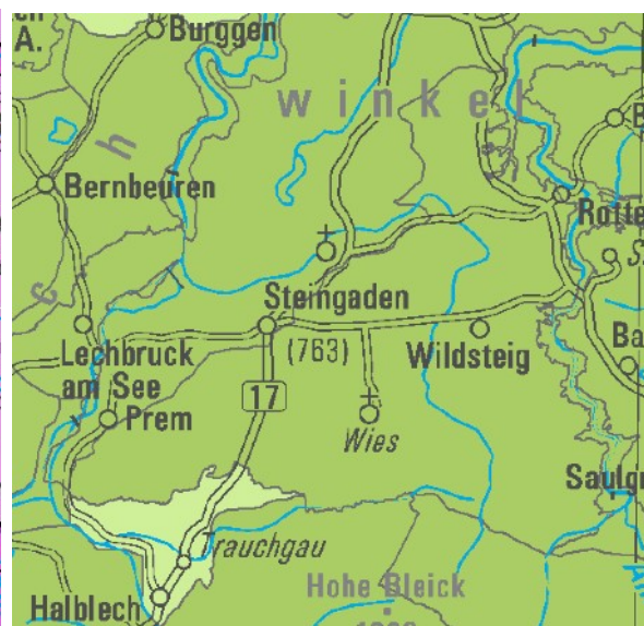
Abbildung 4: Ausschnitt der Karte Landschaftserleben – Erholung, Fachbeitrag zur Landschaftsrahmenplanung Bayern