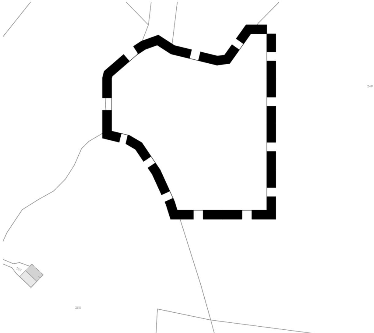
Abbildung 1: Lageplan des Geltungsbereiches der gegenständlichen Planung, unmaßstäblich

Das Plangebiet weist eine Größe von ca. 1,43 ha auf. Die genaue Größe und Lage sind der Flächennutzungsplanzeichnung zu entnehmen.