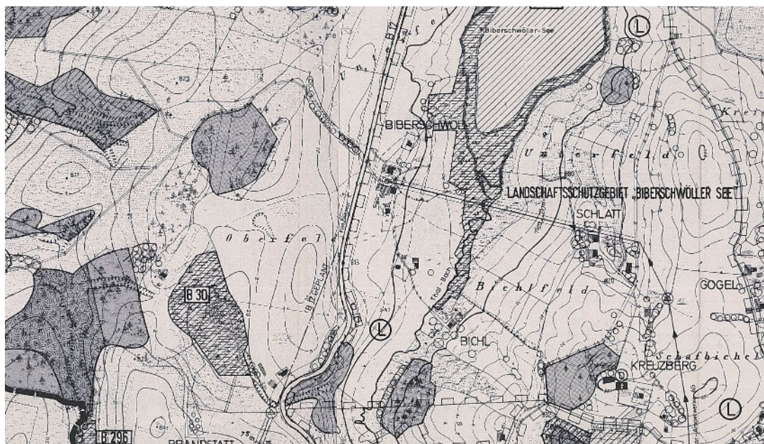
Abbildung 2: Ausschnitt des Flächennutzungsplanes der Gemeinde Pforzen, unmaßstäblich

Die Gemeinde Steingaden verfügt über einen wirksamen Flächennutzungsplan. Dieser sieht bisher für das gegenständliche Plangebiet eine Fläche für die Landwirtschaft vor. Am Südrand der geplanten PV-Freiflächenanlage ist ein als B 30 bezeichnetes Biotop dargestellt, vgl. obenstehende Abbildung 2. Es handelt sich dabei um das Biotop mit der Teilflächennummer 8331-0100-001. Es ist bezeichnet als „Naß- und Streuwiesenkomplex