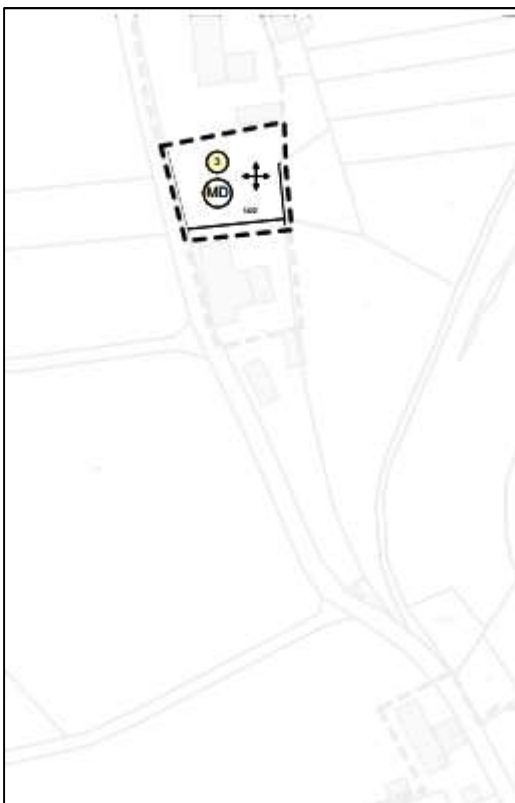
(Ortskern Morgenbach Nordteil)

Der räumliche Geltungsbereich ist in den nachstehenden Lageplänen ohne Maßstab dargestellt: